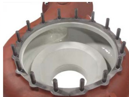
Strat aplicat rezistent la acizi