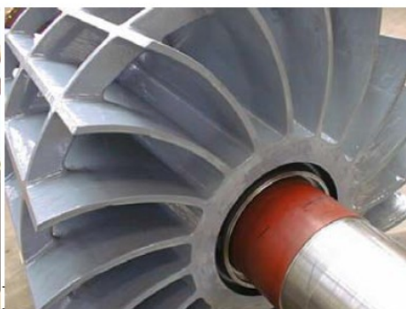
Strat aplicat cu proprietăți antiaderente