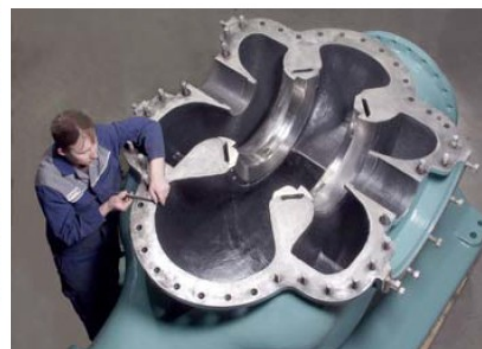
Pompă pentru celuloză și hârtie

CORTROM B.G. - reprezentant Rehart GmbH pentru Romania