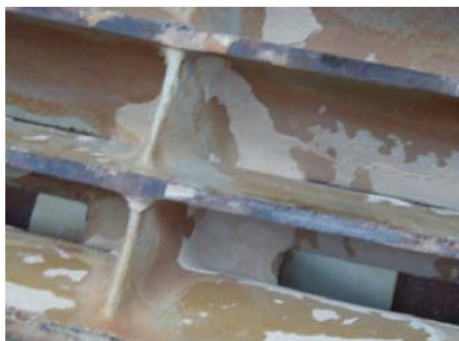
Depunere de calcar